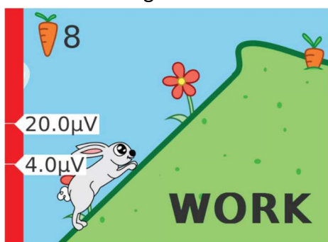
Gioco coniglio: Biofeedback training